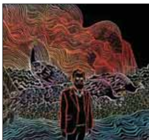
Iron and wine “Kiss each other clean” warner Bros rec.

Οι Mogwai από το «Happy songs for happy people» αλλάξαν ουσιαστικά ρότα αφήνοντας πίσω τον τραχύ ήχο και λοξοδρομώντας από τον κλασικό post rock δρόμο. Το αποκορύφωμα αυτής της πορείας αποτελεί η τωρινή κυκλοφορία τους που εκτός από τα φωνητικά, μην φαντασθείτε όχι πολλά πράγματα, έχουνε εισάγει και στοιχεία από χώρους που ως τώρα δεν είχανε καμία σχέση με τον ήχο τους. Η ροπή τους ειδικά προς το krautrock είναι εξόφθαλμη σε τραγούδια όπως το White noise . Οι Mogwai και μ' αυτό το δίσκο αποδεικνύουν ότι έχουνε τεράστιες δυνατότητες και την ικανότητα να κινηθούν σε διάφορα πεδία προσφέροντας συνθέσεις πολύ υψηλού επιπέδου. Ένας δίσκος πολυδιάστατος σαν αυτόν δύσκολα βρίσκεται στην εποχή μας. A