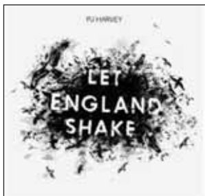
PJ Harvey “Let England Shake” Vagrant rec.

Εκπλήσσει για ακόμη μια φορά η PJ με τον καινούργιο της δίσκο, καθώς και σ' αυτόν παρουσιάζει καινούργια στοιχεία στον ήχο της. Ο τίτλος του δίσκου προϊδεάζει για το περιεχόμενο. Κατά κάποιο τρόπο η PJ αποτίνει φόρο τιμής στη μουσική παράδοση της χώρας στην οποία μεγάλωσε. Σκληρές στιγμές δεν υπάρχουν και πολύ λίγα τραγούδια θυμίζουν κάτι από τις δουλειές της δεκαετίας του '90. Οι ερμηνείες είναι σε ψιλές νότες, χρησιμοποιούνται διάφορα όργανα και παραδοσιακές αγγλοσαξονικές μουσικές φόρμες χωρίς όμως να υπάρχει εγκλωβισμός αλλά περισσότερο προσαρμογή στα σύγχρονα δεδομένα. Η PJ πάντα ήταν ανήσυχη και έψαχνε τη διαφορετικότητα και το “Let England Shake” αποτελεί ακόμη ένα βήμα προς αυτή τη κατεύθυνση. A