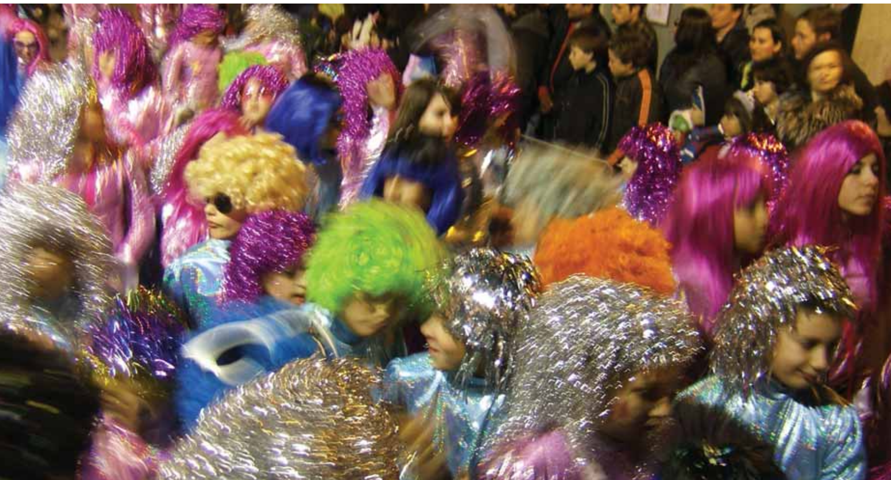
Καρναβάλι Γυναικών Άρτας