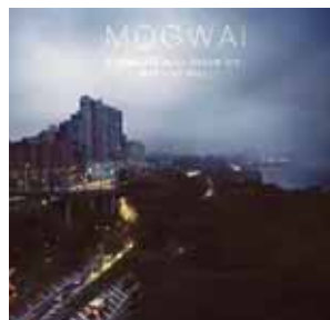
Mogwai “Hardcore will never die, but you will” Sub Pop rec.

Εκπλήσσει για ακόμη μια φορά η PJ με τον καινούργιο της δίσκο, καθώς και σ' αυτόν παρουσιάζει καινούργια στοιχεία στον ήχο της. Ο τίτλος του δίσκου προϊδεάζει για το περιεχόμενο. Κατά κάποιο τρόπο η PJ αποτίνει φόρο τιμής στη μουσική παράδοση της χώρας στην οποία μεγάλωσε. Σκληρές στιγμές δεν υπάρχουν και πολύ λίγα τραγούδια θυμίζουν κάτι από τις δουλειές της δεκαετίας του '90. Οι ερμηνείες είναι σε ψιλές νότες, χρησιμοποιούνται διάφορα όργανα και παραδοσιακές αγγλοσαξονικές μουσικές φόρμες χωρίς όμως να υπάρχει εγκλωβισμός αλλά περισσότερο προσαρμογή στα σύγχρονα δεδομένα. Η PJ πάντα ήταν ανήσυχη και έψαχνε τη διαφορετικότητα και το “Let England Shake” αποτελεί ακόμη ένα βήμα προς αυτή τη κατεύθυνση. A